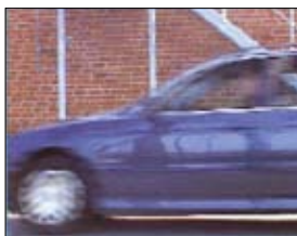
Zwischenzeilenabtastung, 20 ms Unterschied zwischen ungerader und gerader Zählung