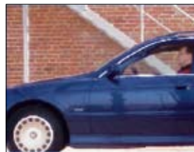
Progressive Abtastung, alle Zeilen werden gleichzeitig erfasst.

Die progressive Abtastung wird anstelle der Zwischenzeilenabtastung von CCTV-Analog-kameras (PAL/NTSC) verwendet. Bei der progressiven Abtastung werden alle Pixel (Zeilen) gleichzeitig erfasst, so dass Bewegungen ohne Verzerrung wiedergegeben werden können.